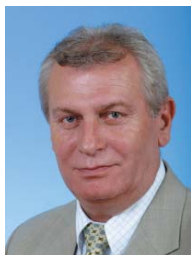
Árva János az MKKSZ elnöke