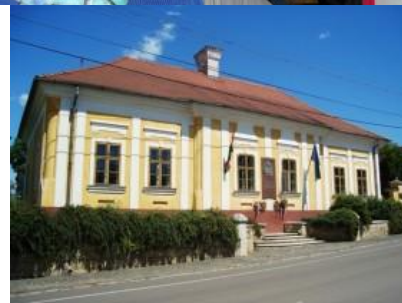
Kossuth Lajos szülőháza

Tovább utaztak Szerencsre, itt a Rákóczi Várat „ostromolták” meg.